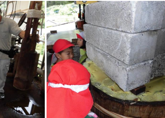
大きな機械がたくさんあり、使い方の説明をしてくれました。…そして、樽に漬かった晩茶もじっくり見学。