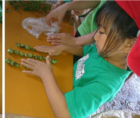
葉っぱを1枚1枚丁寧に摘んで、葉っぱを摘んでいるとお茶の実もたくさん採れました。